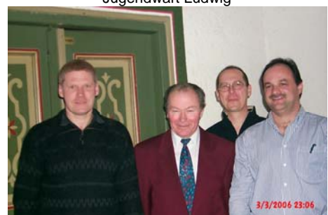
Die neue Vorstandschaft