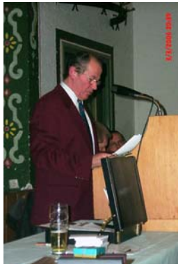
1. Vorstand Kornherr