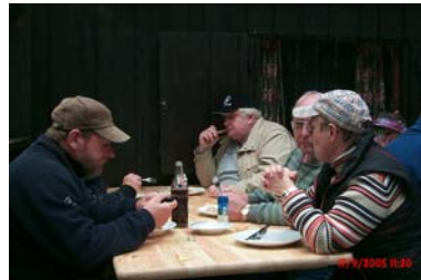
es scheint allen