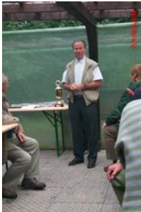
1. Vorstand Kornherr