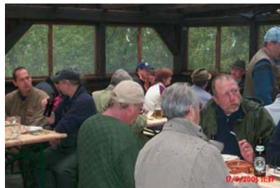
hat ein tolles Kesselfleisch gekocht