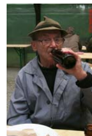
war es auch nicht