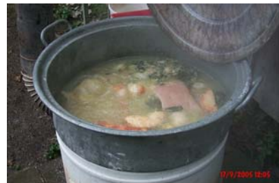
nur Erwin kann's