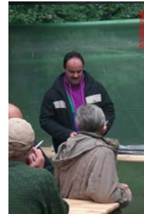
2. Vorstand Lange